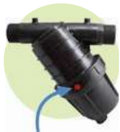
punto pieza. color of spot on item pastille de couleur sur pièce

Y conical mesh filters-professional range / gamme professionnelle-filtres de mailles en Y